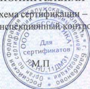
Схема сертификации – 1с(м). Инспекционный контроль – апрель 2022 года, апрель 2023 года.